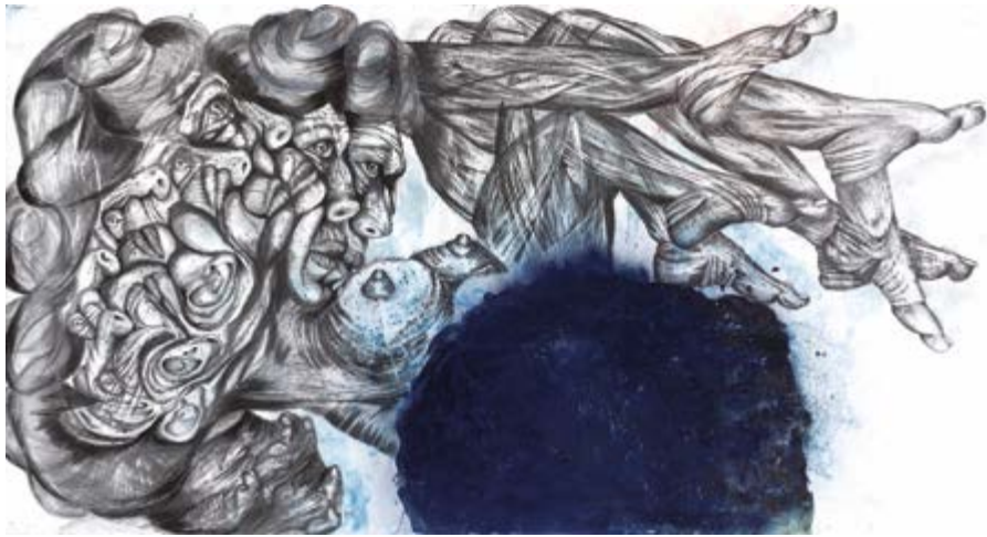
ROEY VICTORIA HEIFETZ FRAU IN BLUE, 2017 MIXED MEDIA ON PAPER 150 X 300 CM