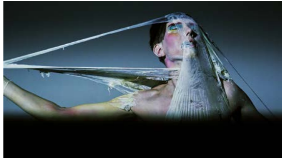
NELSON SANTOS NEW HUMAN, 2018 VIDEO INSTALLATION WITH ORIGINAL SOUND UNIQUE