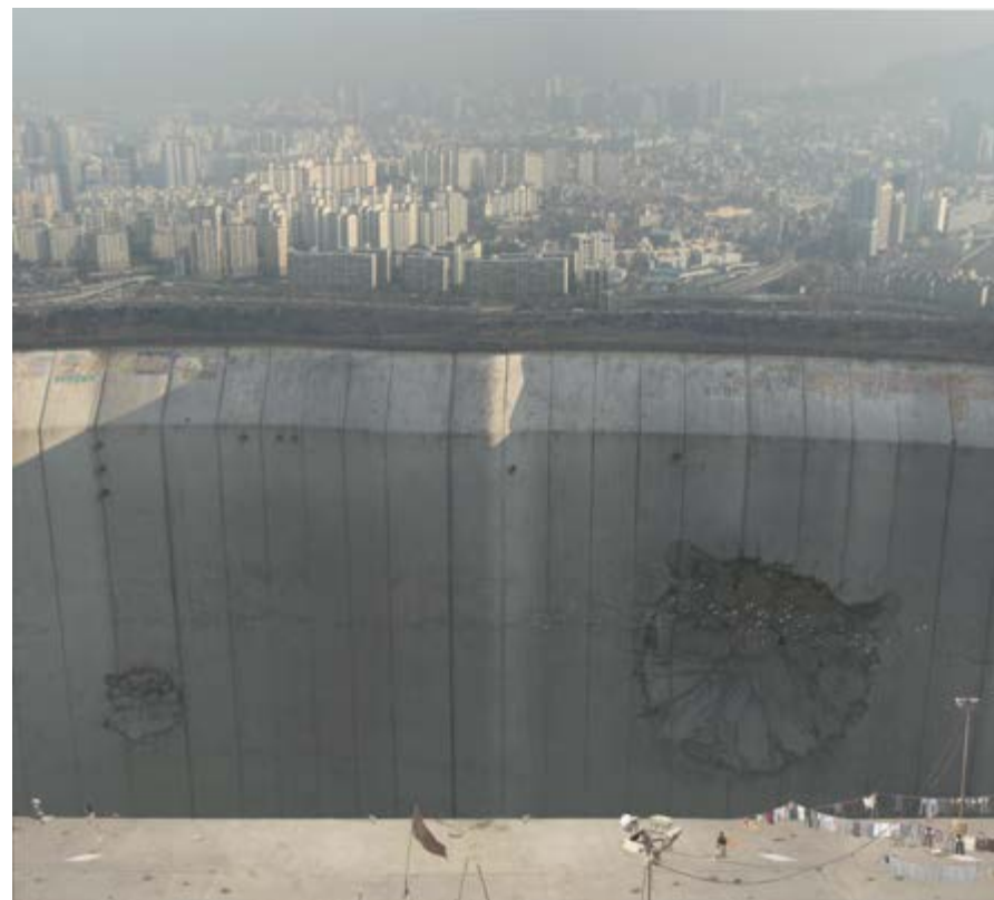
SVEN SAUER & IGOR POSAVEC WENN IHR UNS NICHT TRÄUMEN LASST, LASSEN WIR EUCH NICHT SCHLAFEN, 2017 FINE ART PRINT ON HANDMADE PAPER 75 X 65 CM EDITION 1/6