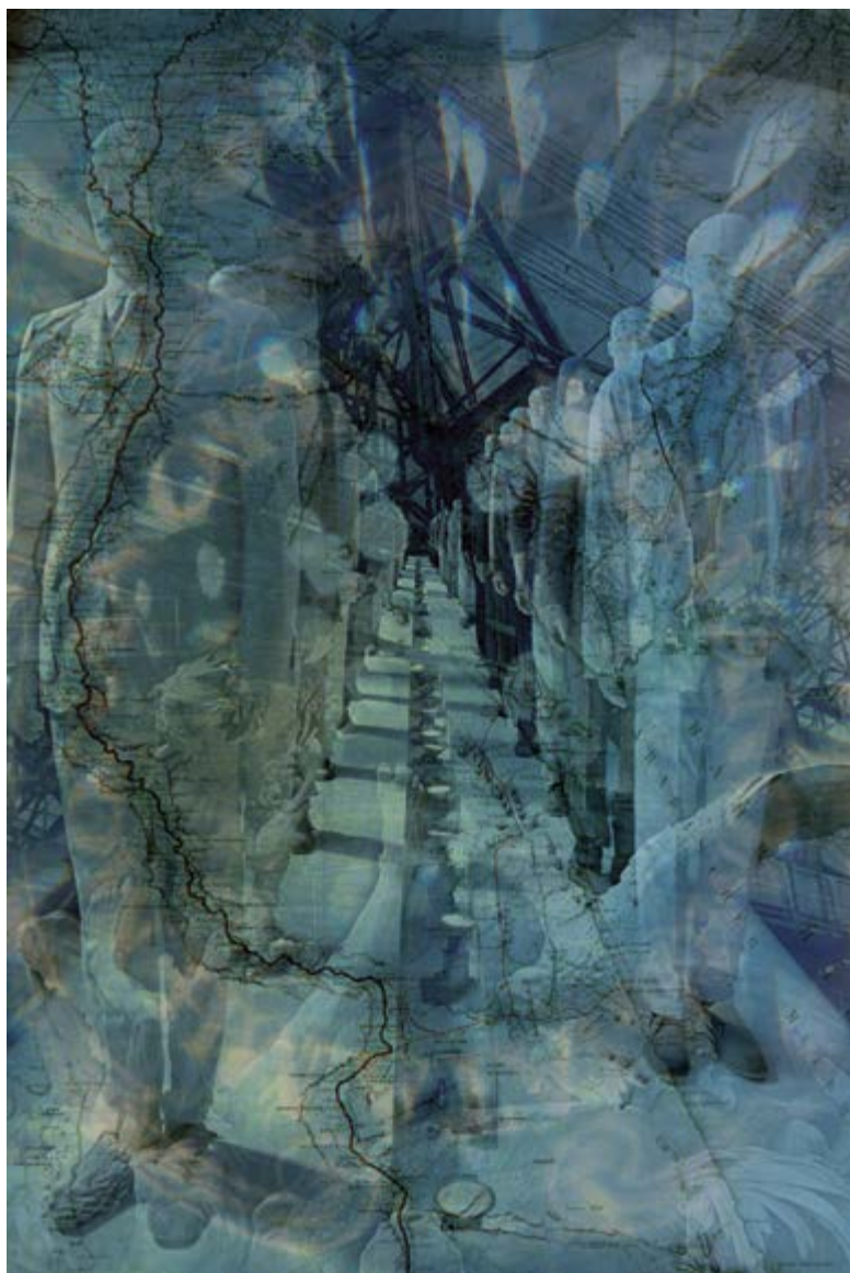
BERNHARD MUSIL ROYAL CHAOS #7, 2016 FINE ART PRINT ON ALU-DIBOND EDITION 1/7 + 2AP 180 X 120 X 15 CM