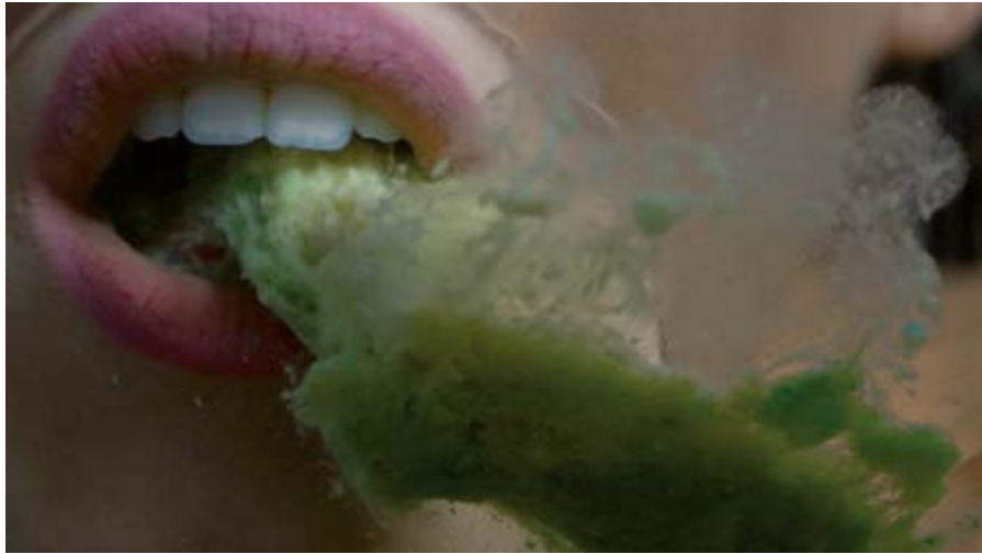
BRUNA MAYER LINFA, 2017 VIDEO EDITION 1/5 + 2AP