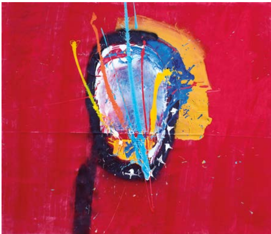
NOAH BECKER DEVIL'S SWEETHEART, 2017 ACRYLIC ON VELVET 125 X 150 CM