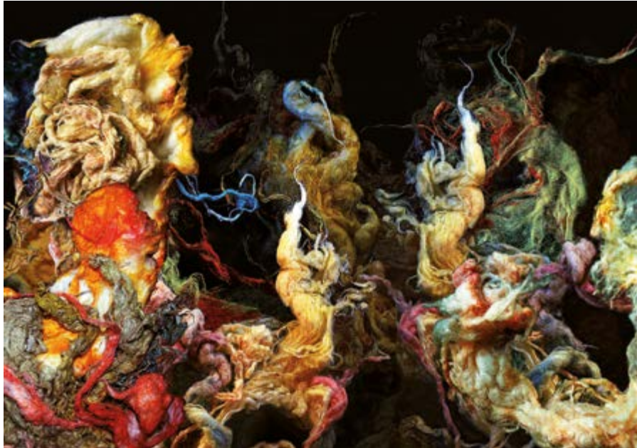
MARIA CRISTINA JESUS DE SANTANA TEARS OF MOTHER NATURE, 2015 FINE ART PRINT BEHIND PLEXIGLAS 150 X 220 CM EDITION 3 + 2 AP