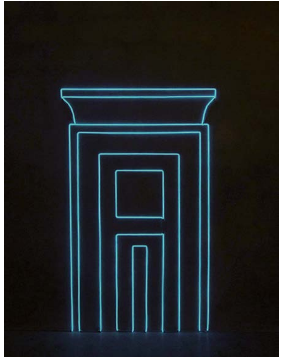
CECILIA ÖMALM DOOR TO THE AFTERLIFE I, 2012 ELECTROLUMINESCENT LIGHTWIRE AND MIXED MEDIA 183 X 116 CM EDITION 2/5 + 2AP