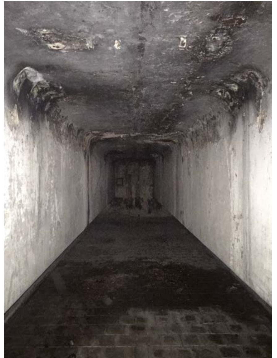
JASCHA HAGEN STERNBURG ETUDE, 2018 SOUND INSTALLATION UNIQUE